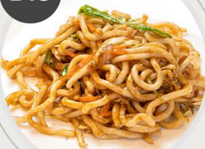
Udon con verduras