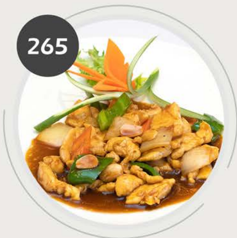
Pollo con almendras