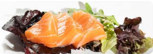
Sashimi de salmón