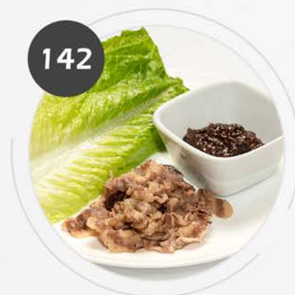
Rollo de ternera guayu