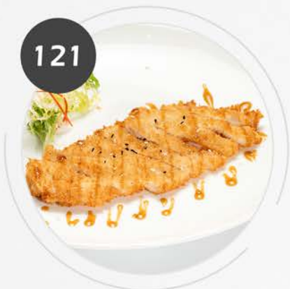
Pechuga rebozada con salsa yakitori