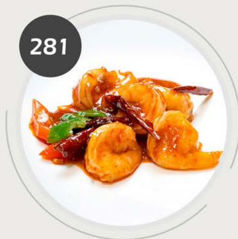
Langostinos con salsa picante