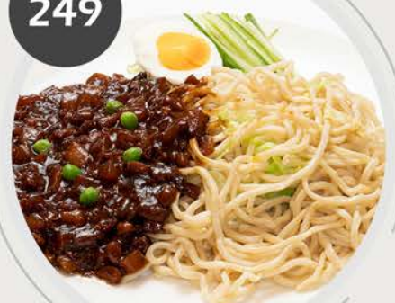
Tallarines con salsa frita PM