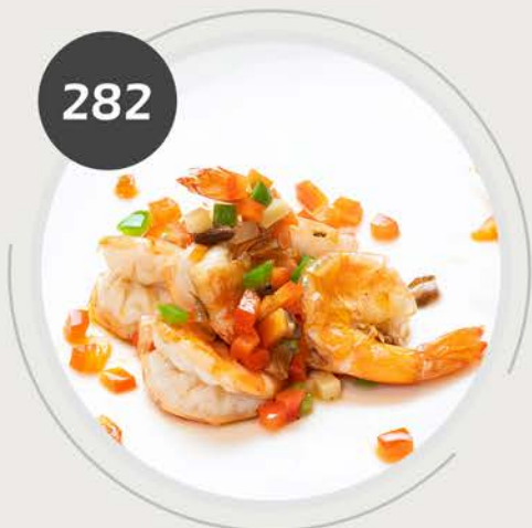
Langostinos a la sal y pimienta