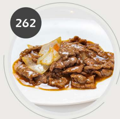
Ternera con cebolla