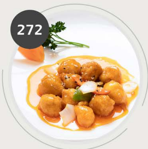
Pollo agri dulce