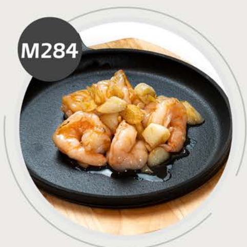
Langostinos con ajo a la plancha