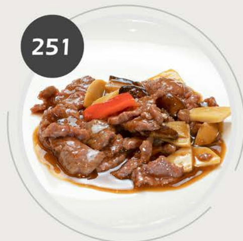
Ternera con bambu y setas