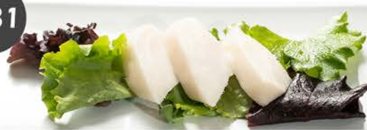
Sashimi de pez mantequilla