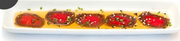
Tataki de ternera