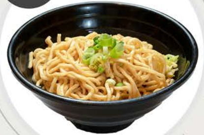
Tallarines estilo chino