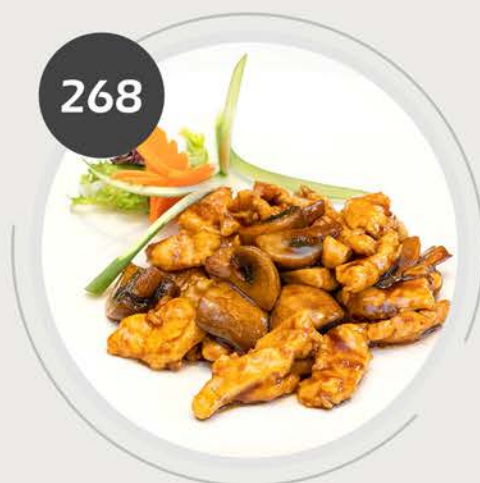
Pollo con champiñones