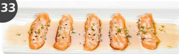
Carpaccio de salmón