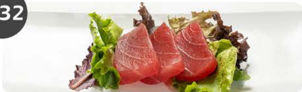
Sashimi de atún