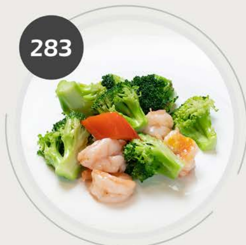
Langostinos con brócoli